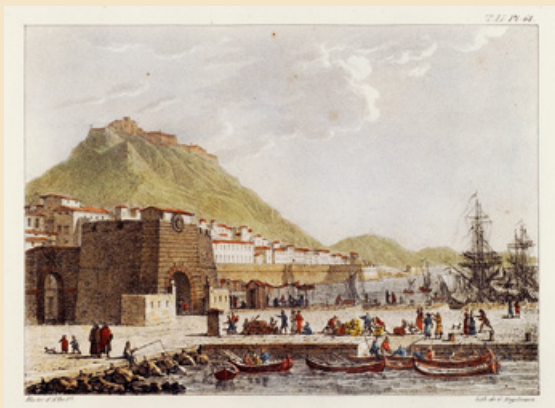
GODEFROY ENGELMANN: Vista del port d'Alacant (1824) Biblioteca Valenciana Nicolau Primitiu.