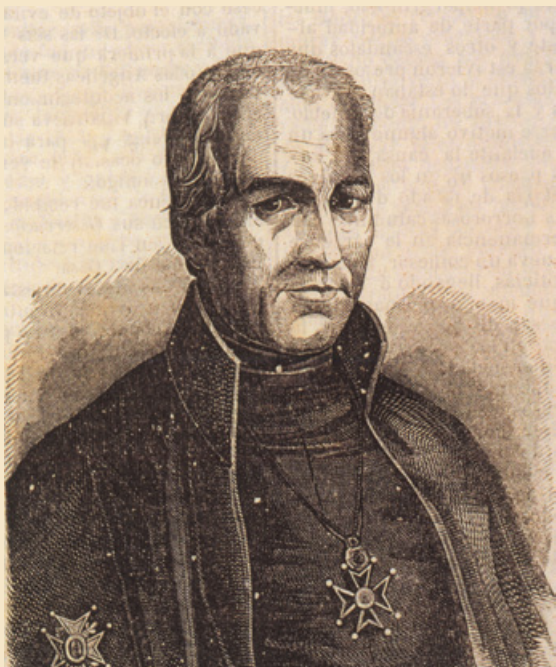
Retrat de Joaquim Llorenç Villanueva, diputat a les Corts de 1810. En Semanario Pintoresco Español, 1848, p. 391.