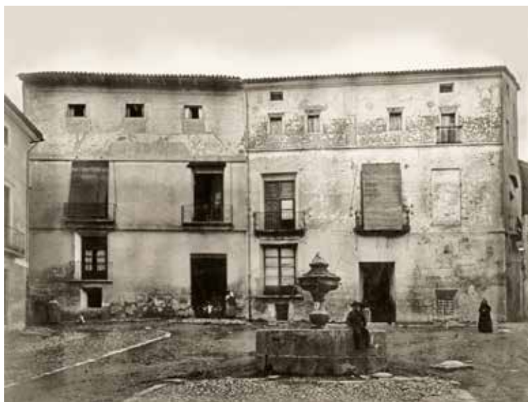
[c. 1900] Casa natal de la familia Borja, donde nació Rodrigo de Borja, futuro papa Alejandro VI.

Ello nos indica que la conciencia de clase fue el motor que marcó su evolución posterior.