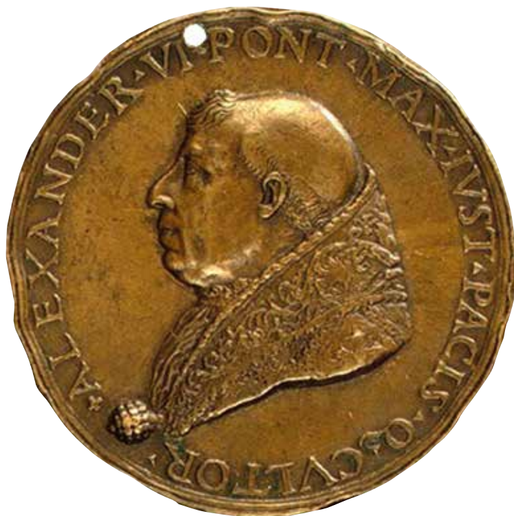
Medalla de Alejandro VI.

de los reinos de Aragón y Castilla, librando a Castilla de sus desgarradoras guerras civiles. Sin embargo permaneció aparentemente neutral con respecto al reino de Nápoles, ya que dicho territorio era reclamado por las coronas española y francesa, por lo que jugó con las aspiraciones de ambas coronas de acuerdo con sus intereses.