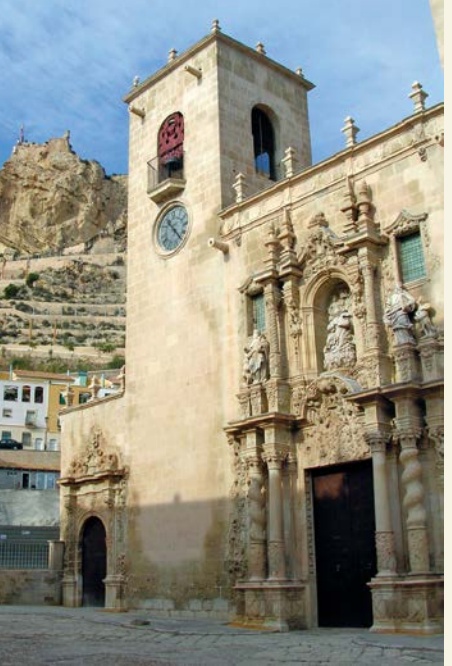
La Basilica de Santa María ubicada en la plaza de Santa María de Alicante.