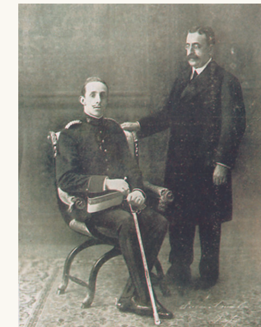
José Canalejas Méndez y Alfonso XIII.