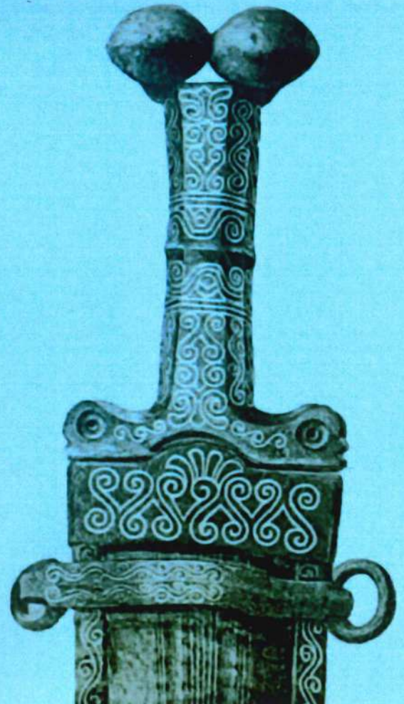
DETALLE DE REPRODUCCIÓN DE PUÑAL DE ANTENAS, DE JUAN CABRÉ. FUENTE IPCE

WEB EN ESPAÑOL DE LAS JORNADAS EUROPEAS DE ARQUEOLOGÍA 2024