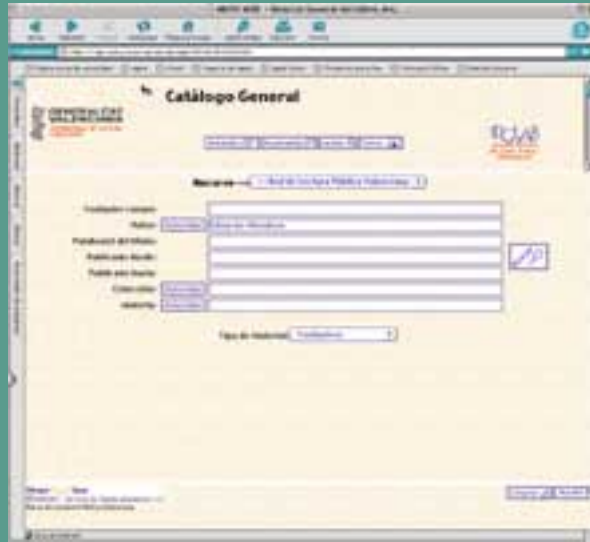
Ficha de búsqueda del Catálogo General.

El Catálogo Colectivo de la Red de Lectura Pública Valenciana queda consultable para el usuario vía WEB, bien para realizar una búsqueda en todo el catálogo colectivo en sí o simplemente utilizar la opción de un menú desplegable que le lleva a la consulta individualizada de cada catálogo de biblioteca. Además, también permite acotar la búsqueda sobre un determinado tipo de material (libros, revistas, vídeos, CD y cassetes, CD-ROM y disquetes). La consulta nos aclara también dónde podemos localizar ese documento: