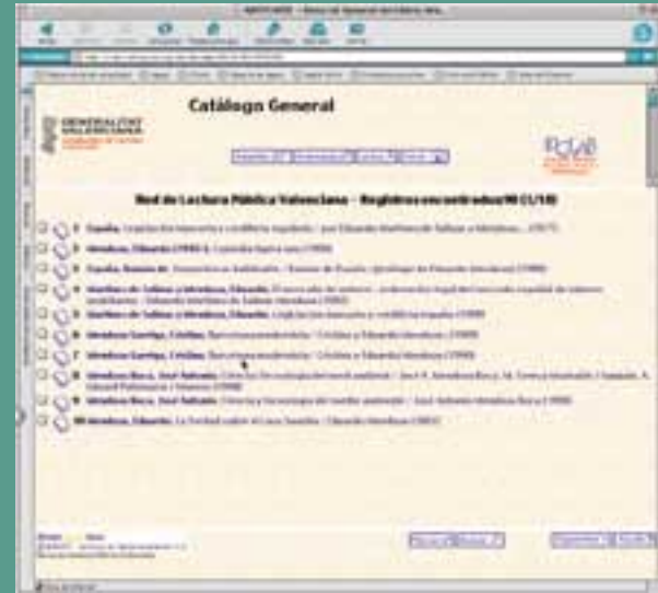
Ejemplo del resultado de la búsqueda.

bibliotecas valencianas sólo podían ser abordados mediante la solución de un catálogo colectivo plenamente en línea que permitiera la fusión de los catálogos preexistentes, la captura fluida de registros de la base de datos común, la conexión con otros catálogos vía protocolo Z39.50 y la actualización continua de la base de datos de lectores. A su vez, el programa debía poseer la suficiente versatilidad para crear subcatálogos virtuales por cada centro bibliotecario, de forma que los registros bibliográficos también se pudieran consultar individualizadamente por biblioteca, así como permitir la consulta simultánea de los fondos de todas las bibliotecas de un mismo municipio e, incluso, de una comarca.