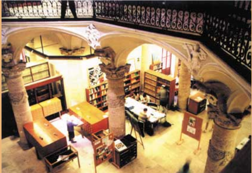
Vestíbulo de la Biblioteca Pública de València.

"La Biblioteca Pública siempre me atrajo mucho por esa dimensión social que tiene y que no tiene la Universitaria. Yo trabajé todo lo que pude, y creo que conseguimos una biblioteca modélica. En parte fue también por mi carácter, soy una persona que se entusiasma con rapidez y me gusta trabajar y proyectar. Los doce años en la Biblioteca me resultaron muy gratificantes, era lo que yo había soñado cuando estudiaba"