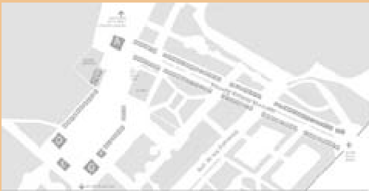
Plànol de localització de la fira dins del recinte dels Jardins del Real.