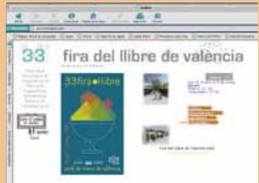
www.firallibre.com (pàgina web oficial de la fira.)

Quant al finançament de l'event, la Fira va comptar amb la col·laboració de l'Ajuntament de València, que ha augmentat enguany la seua col·laboració, la Direcció del Llibre, Arxius i Biblioteques, Bancaixa, la CAM, CajaAstur, RTVV i Telefónica, i la Diputació de València, que enguany ha reduït l'aportació en 6.000 euros menys, passant de 15.000 a 9.000 euros. En total la Fira va rebre 60.000 euros en qualitat de subvencions diverses.