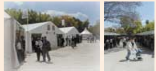
Dues vistes dels corredors i les casetes situades al Passeig Antonio Machado.

Quant al finançament de l'event, la Fira va comptar amb la col·laboració de l'Ajuntament de València, que ha augmentat enguany la seua col·laboració, la Direcció del Llibre, Arxius i Biblioteques, Bancaixa, la CAM, CajaAstur, RTVV i Telefónica, i la Diputació de València, que enguany ha reduït l'aportació en 6.000 euros menys, passant de 15.000 a 9.000 euros. En total la Fira va rebre 60.000 euros en qualitat de subvencions diverses.