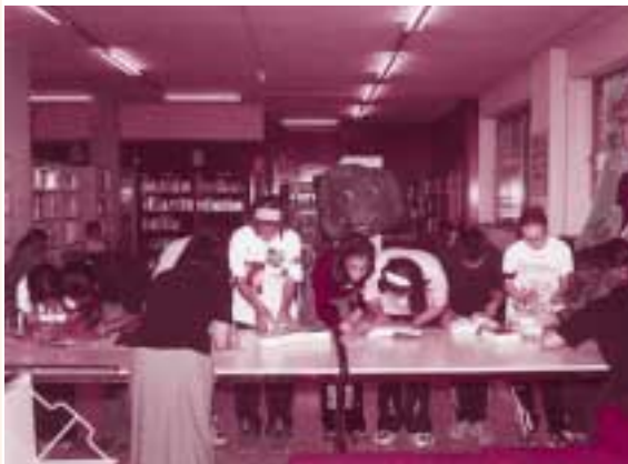
La Biblioteca se ocupa también de formar como lectores a los usuarios más jóvenes.