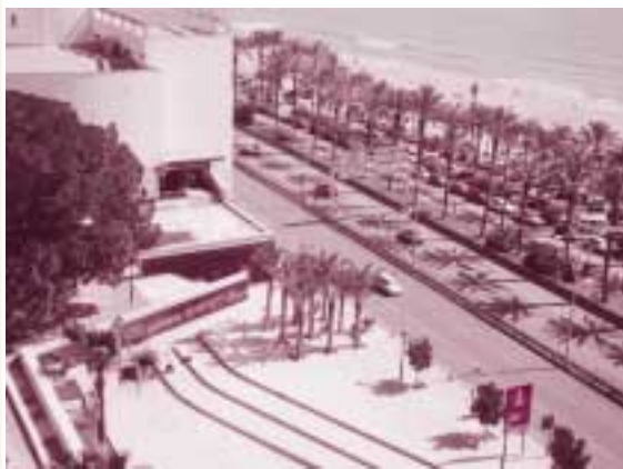
Vista panorámica de la Biblioteca Pública d'Alacant, junt a la platja del Postiguet.

Horarios. de lunes a viernes de 9:00 a 20:30 h. ininterrumpidamente. Sábados de 9:00 a 13:30 h. ☐ Verano: cerrada los Sábados del 15 de Junio al 15 de Septiembre Agosto de 9:00 a 14:00 h.