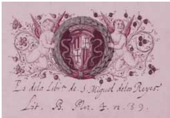
Logotipus de La Biblioteca Valenciana Digital (BIVALDI).

http://cervantesvirtual.com/noticias/2002/bibvalenciana.shtml