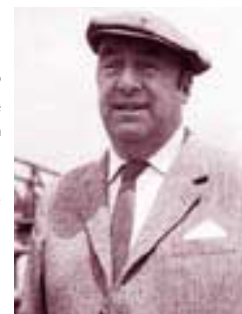
Neruda se aficionó a coleccionar libros de ediciones exóticas durante sus estancias en el extranjero como diplomático.

Neruda, cuyo nombre real era Neftalí Ricardo Reyes Basoalto, se aficionó a coleccionar libros de ediciones exóticas durante sus estancias en el extranjero como diplomático, que le llevaron a vivir varios años en Birmania, Ceilán, España, México y Francia. Fue en París donde consiguió sus más preciados "trofeos", que ahora podrán consultarse, entre los que destacan un ejemplar de