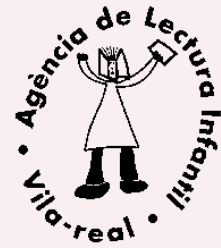
1. Interior de las instalaciones de la Agencia 2. Logotipo de la Agencia de Lectura.

El pasado día 1 de octubre se procedió a la apertura de la nueva agencia de lectura infantil de Vila-real, la cual había sido inaugurada oficialmente en las fiestas patronales de septiembre. Con este nuevo equipamiento cultural se pretende dar servicio a los cerca de 2.000 niños de la zona sur de la ciudad, para los cuales se ha realizado una campaña de información personalizada a través del correo. Durante el primer mes de funcionamiento, la nueva agencia de lectura ha recibido 1.196 visitas. Cuenta con gestión informatizada de socios, libros y préstamos y conexión a través de OPAC con la Biblioteca Central, por lo cual pueden ser consultadas las 40.000 obras que componen el fondo del Servicio Municipal de Bibliotecas.