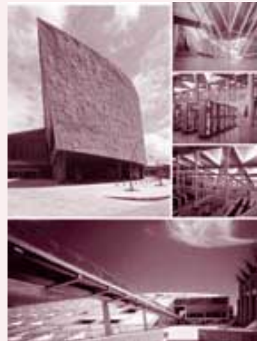
2. Diverses perspectives de la biblioteca d'Alexandria.