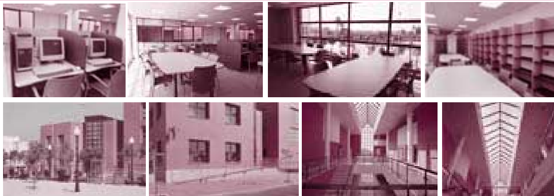
Distintes vistes de l'interior i la façana de la biblioteca de mutxamel

informatitzats. Per als projectes esmentats, la feina del personal de les biblioteques s'ha vist reforçada per la incorporació temporal de dos becaris.