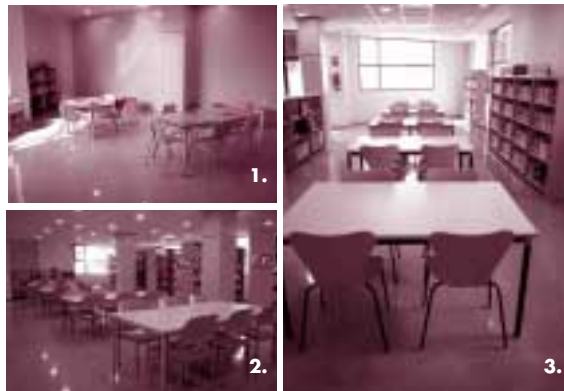
1. Sala de prelectors 2. Sala de consultes 3. Sala infantil-juvenil

Xirivella compta en l'actualitat amb una xarxa de biblioteques públiques municipals ubicades en diferents barris de la població. Des de 1996 el barri de la Llum disposa d'un servei de biblioteca instal·lat al Centre Sociocultural barri de la Llum. El passat 27 de setembre, l'Ajuntament inaugurarà les noves instal·lacions de la Biblioteca Central, ubicada a la Casa de la Cultura des de 1987, que ha estat ampliada i renovada, i actualment es troba a les dependències del Centre Cultural Ausiàs March. També es va obrir el passat mes de novembre una nova biblioteca que compta amb una superfície de 266,90 m 2 i dona servei a un ampli sector