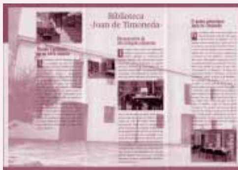
Tríptic de presentació de la Biblioteca Joan Timoneda a Beniferri, on podem veure les imatges de com la biblioteca s'ubica en dues alqueries del segle XIX rehabilitades, així com distintes estàncies de l'interior.