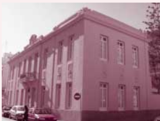
Biblioteca de Torrevieja ubicada en la casa natal del político Joaquín Chapaprieta Torregrosa

Biblioteca Pública Municipal "Carmen Jalón" a C/Joaquín Chapaprieta , 39- 03180 Torrevieja. Tl.: 96.570.61.64 Horario : De lunes a viernes 9 a 15 h y de 16 a 21 h. Sábados por la mañana de 9 a 13 h. c/e: biblioteca@torrevieja.infoville.net Socios activos: 1754 - Nº de volúmenes: 18.506 Informatización: Biblio 3000. Acceso público al catálogo OPAC, a Internet y al catálogo colectivo de todas las bibliotecas del Estado.