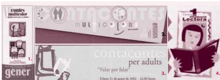
1, 2 y 3 tres marca pàgines on es veu les activitats de algunes de les biblioteques a València i alredecors.. 4 Campaya pública municipal d'animació lectora a la Vall d'Albaida.

la "Divina comedia" de 1529, un "Quijote" de 1617 y las pruebas de imprenta de "Los trabajadores del mar", publicada en 1866, con correcciones en los márgenes manuscritas por Víctor Hugo. Además incluye un ejemplar de "La Araucana" de Alonso de Ercilla, datada en 1632, la "Enciclopedia" de Diderot y D'Alembert, de 1751, etcétera. Según Osés, gran parte de los libros que constituyen la nueva biblioteca los envió el propio Neruda desde Francia en 1972.