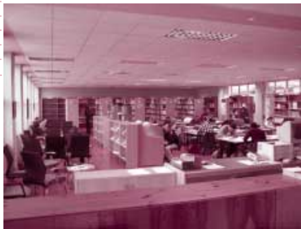
Interior de la sala d'adults

Els nous serveis del centre completen ara la Biblioteca Municipal de Xàtiva, on entre altres peculiaritats, destaca l'existència d'un fons antic interessant provinent, en la seua major part, de l'antic Ateneu Popular, desaparegut en 1936, amb obres des del segle XVII al primer terç del XX, principalment de temàtica històrica i literària i una secció que conté un valuós fons de publicacions periòdiques del primer terç del segle XX, un important nombre de publicacions festives (llibres de Fira, falles, festes de carrer...), així com una àmplia secció de monografies, publicacions periòdiques modernes, cartells i fullets.