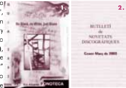
1. Imatge de la Fonoteca 2. Imatge del butlletí discogràfic.