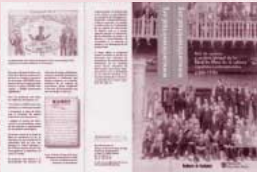
Portada del Tríptic. Archivo León Sánchez Cuesta, Residencia de Estudiantes

fons així ho desitgen, es pot accedir a còpies digitals.