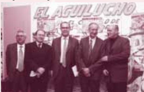
Enguany el Saló va retre un homenatge al còmic valencià