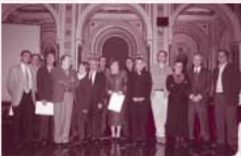
Guanyadors dels premis als millors llibres de la Comunitat Valenciana el passat 20 de novembre, en commemoració de l'edició de Tirant lo Blanch .