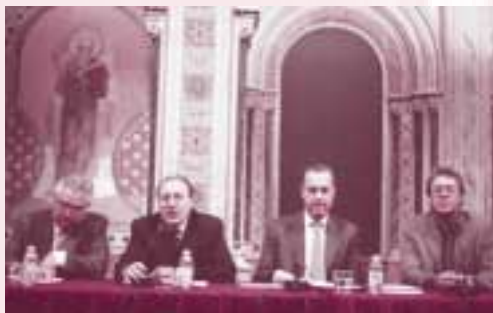
Imatge de la inauguració del II Saló Valencià del Llibre.