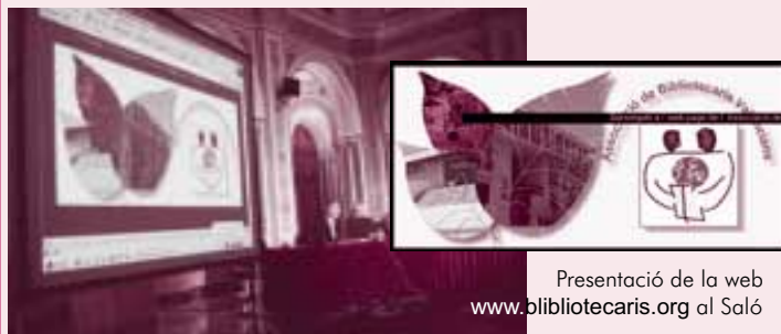
Presentació de la web www.bibliotecaris.org al Saló

El Saló també va ser l'ocasió per tractar el llibre en el marc de les últimes tecnologies. En aqueix sentit es van presentar diverses pàgines web relacionades amb el món del llibre, concretament, la de La Direcció General del Llibre ( www.cult.gva.es/dglab ), de la qual parlem més extensament en la secció Arxius i Biblioteques.Com, la dels il·lustradors valencians ( www.apiv.com ) i la de l'Associació de Bibliotecaris Valencians ( www.bibliotecaris.org ), així com el projecte de creació de la web dels distribuïdors (ADILEVA).