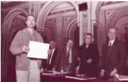
L'editorial Media Vaca va ser guardonada amb el premi al Millor llibre valencià de 2001.