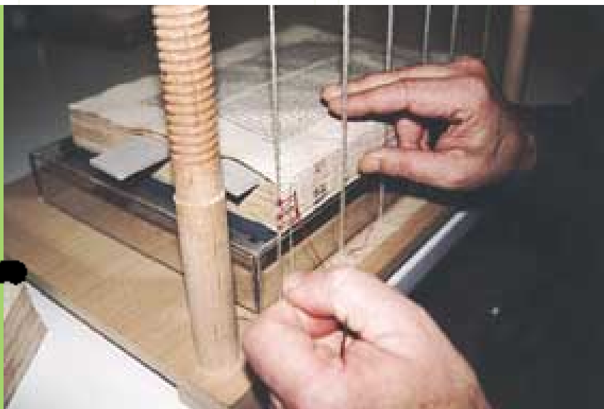
Cosiendo y confeccionando las cabezas de un incunable.

intervenciones correctas en todas las disciplinas que conforman el Patrimonio Histórico Cultural.