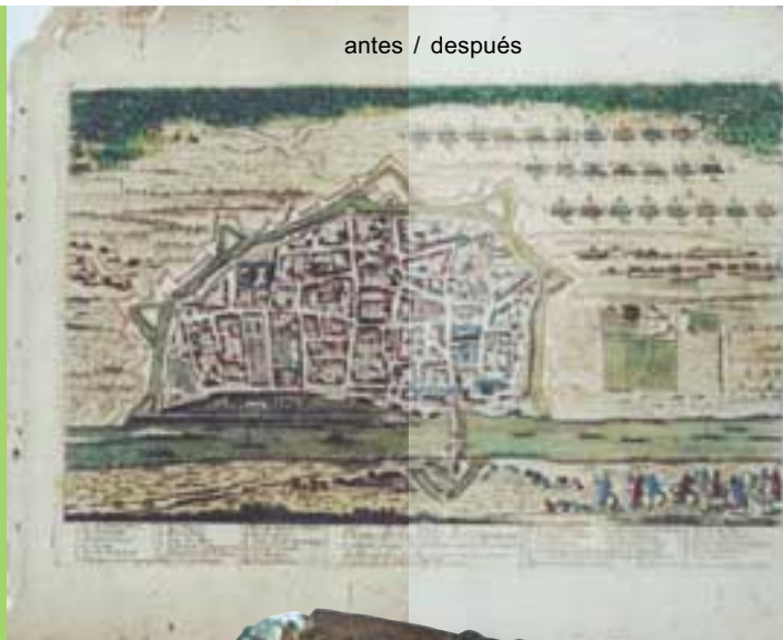
Departamento de Restauración de la Biblioteca Valenciana, y un "Grabado de la serie Le THEATRE de la guerre en Allemagne, 1697". Antes y después de su Restauración.

la administración, ha limitado el éxito de esta asociación.