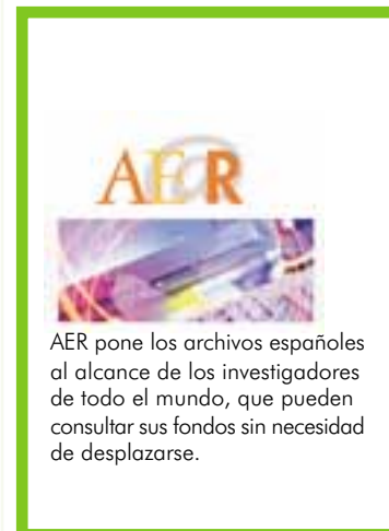
AER pone los archivos españoles al alcance de los investigadores de todo el mundo, que pueden consultar sus fondos sin necesidad de desplazarse.

autónomas están también poniendo en funcionamiento procesos similares aplicados a sus archivos. Se trata de optimizar recursos y de adaptar la tecnología existente a las necesidades de los archivos, para poner a disposición de los ciudadanos sus fondos, a través de diferentes programas informáticos, y garantizar un acceso democrático, directo y gratuito. En este sentido, son diversas ya las iniciativas que están siendo creadas por los gobiernos autonómicos, entre ellas, el proyecto de informatización de los archivos valencianos, impulsado por de la Generalitat Valenciana, a través de la Direcció General del Llibre, Arxiu i Biblioteques, y que en los próximos meses se ocupará de ultimar la digitalización de sus archivos, con el objetivo de presentarlos en red dentro de un portal que ofrezca el acceso tanto a las imágenes, como a los textos.