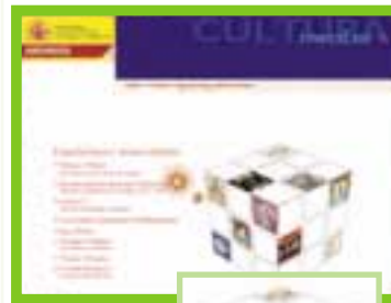
Exposiciones y visitas virtuales en red.

Paralelamente a este proyecto de ámbito estatal, las distintas comunidades