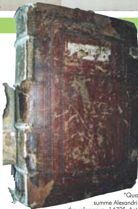
"Quarta pars summe Alexandri de Ales thewologorum, 1472". Antes de su restauración (El texto está tomado del lomo, el año del colofón). ARRIBA es el mismo incunable después de su restauración.

Siempre he dicho a mis alumnos que la restauración es una profesión muy poco agradecida, y que por muy buen profesional que se pueda ser siempre surgirán momentos de desesperación, al no poder resolver todos los problemas de conservación que se le presentan al profesional. En cambio, también existen momentos de satisfacción y orgullo al saber que una parte de ese patrimonio cultural subsiste gracias a nuestra intervención.