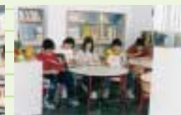
Zona de Consulta (internet) i la sala infantil.