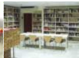
Sala de adultos.