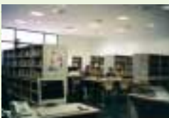
Sala de adultos.