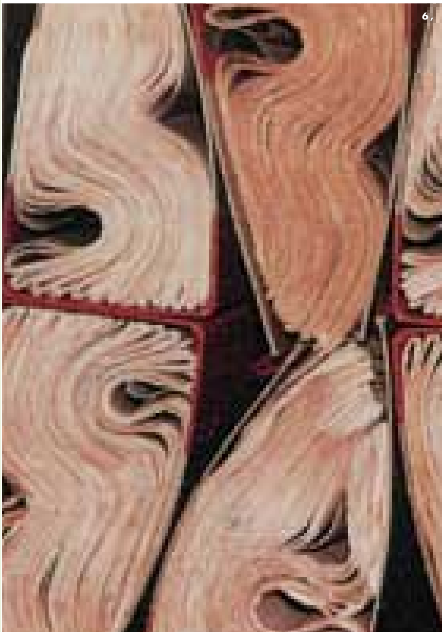
3, Portada del projecte de la casa de l'Ajuntament. 4, Llibre d'Actes Municipals de 1866. 5, Portada del Llibre de festes de 1945. 6, Imatge treta de la portada de la publicació “Reglamento del Archivo Municipal de Paterna”. Detall del dipòsit de l'Arxiu Administratiu.

“En els últims anys –comenta l'arxiver– l'arxiu ha seguit dia a dia els esdeveniments relatius a Paterna, i en eixe sentit, des de 1995 guardem tot tipus de documentació generada pels comicis electorals així com els articles de premsa (original i còpia) sobre Paterna, junt a totes les publicacions de premsa local”.