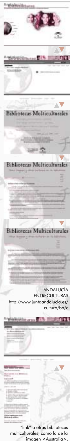
"link" a otras bibliotecas multiculturales, como la de la imagen <Australia>.

Como novedad para este año, este servicio ofrecerá la posibilidad a sus usuarios de evaluar la calidad del sistema, una vez que la biblioteca emita la respuesta a la demanda realizada, indicando su grado de satisfacción. En la actualidad, un total de 452 bibliotecas públicas andaluzas cuentan ya con conexión a Internet, como parte del proyecto de la Segunda Modernización de Andalucía, en el que Patrimonio Histórico de Andalucía ha invertido 1,8 millones de euros, y que busca acercar a los lectores andaluces a la sociedad del conocimiento.