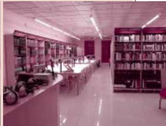
A la planta de dalt, on abans hi havia un saló d'actes, s'hi ha habilitat ara un espai com a sala de consulta i lectura per al públic adult. La sala d'adults facilita els serveis de lectura en sala, accés a internet gratuït, i un servei de consulta dels fons de la biblioteca.