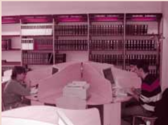
La nova Biblioteca d'Alcàsser ofereix accés gratuït a Internet, amb temps de consulta limitat. Els menors de 16 anys han de dur una autorització signada pels pares.

Cooperació amb activitats promogudes per altres associacions.