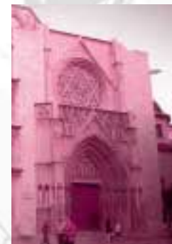
La Catedral de València.

El archivo documenta históricamente la llegada del Santo Cáliz de la Última Cena a València en 1416 traído por el rey Alfonso El Magnánimo y su entrega por el monarca ocho años después a la Catedral. Además, recoge también una reproducción de la anotación original que en 1608 escribió en su biblia el arzobispo de València, San Juan de Ribera, en la que el prelado certifica que "este cáliz se conserva hoy en nuestra Catedral". Entre otros documentos, destacan el referido al traslado momentáneo en 1809 del Santo Cáliz de la Catedral de València a Alacant y, después, a Mallorca y Eivissa durante la invasión francesa y el acuerdo del cabildo valenciano de instalar en 1916 el Santo Grial en su capilla actual en la Catedral, cuando desde el siglo XV permanecía en un relicario de la Seu.