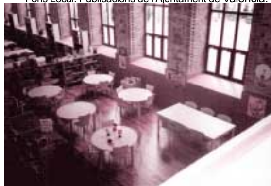
Centre cultural de la Petxina.

-Fons Local: Publicacions de l'Ajuntament de València.