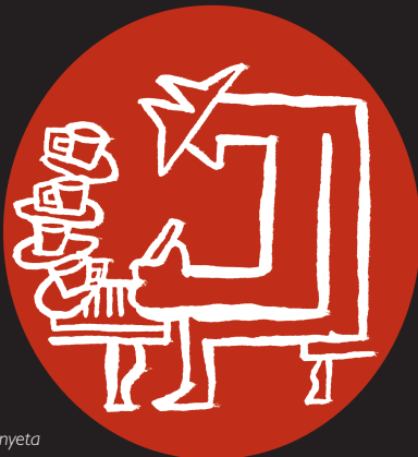
Vinyeta d'Alejandra Hidalgo