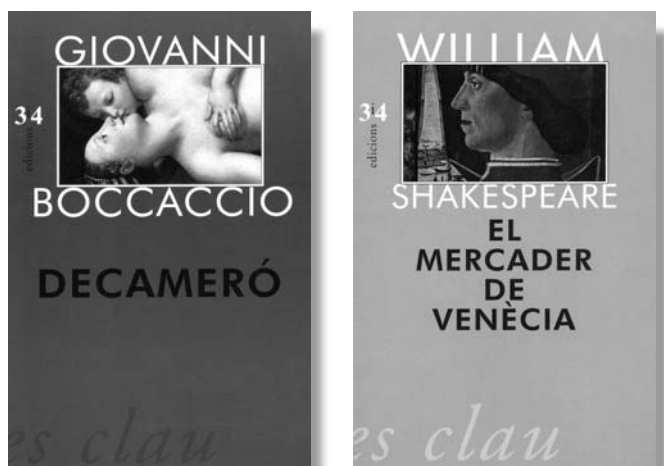
La més veterana, "Llibres Clau" transita, des de fa 28 volums, per la senda dels clàssics de la literatura universal i de la literatura catalana, i aplega una nòmina d'autors substanciosa.