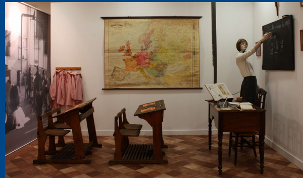
Recreació de l'aula