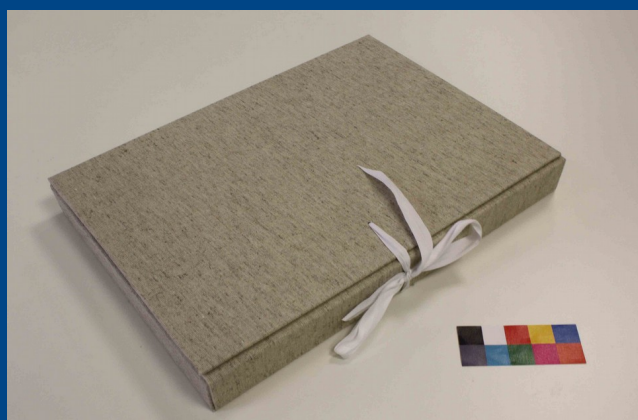
Carpeta de conservació