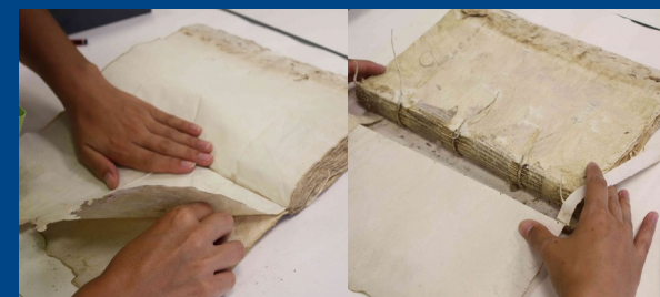
Desmuntatge del llibre

davant i per darrere, així com part del paper en els primers i últims folis. A més, tot el volum presenta molta fragilitat, els folis han perdut. Les capçades estan molt deteriorades i han perdut la seua funcionalitat. Finalment, alguns folis en l'interior estan afectats pel deteriorament de la tinta ferrogàlica, i presenten un alt nivell d'acidesa. En alguns d'aquests folis hi ha parts perdudes del text per haver-s'hi caigut la tinta.