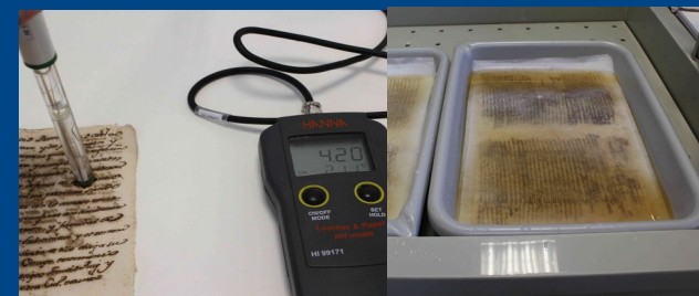
Mesura de ph

La restauració comença amb el desmuntatge del volum, separant la coberta del cos del llibre. A continuació es realitza una neteja en sec en tots els folis per a continuar després amb el llavat per immersió en aigua i alcohol. Aquells folis afectats per la tinta ferrogàlica són sotmesos a un tractament de desacidificació per bany després del llavat.