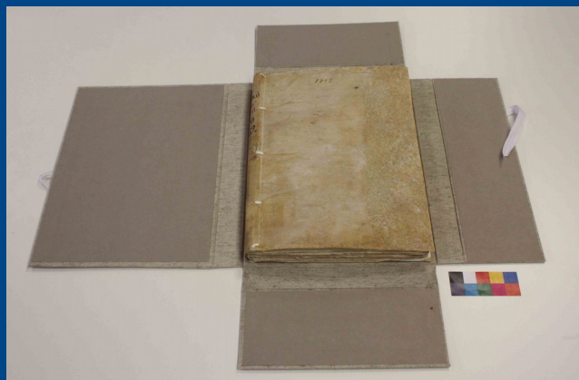
Estat final i carpeta