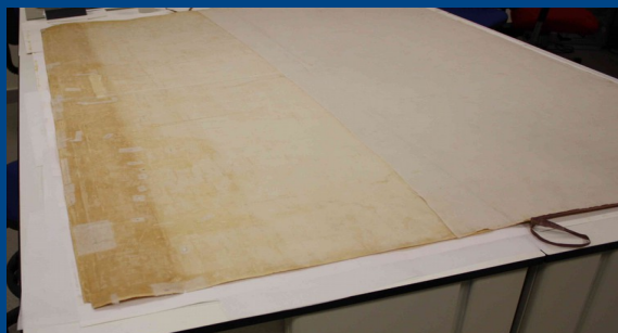
Reparaciones por el reverso

Se retira la tela en la parte superior por estar muy deteriorada y se consolidan desde el reverso todos los rasgados y faltantes. En el anverso estos últimos se reintegran con papel japonés y a nivel colorimétrico con acuarelas.