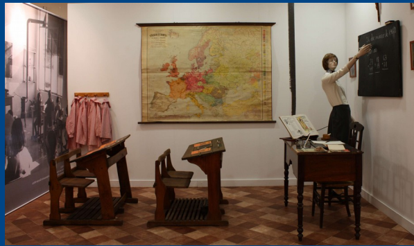
Recreación del aula