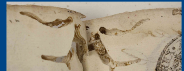
Galerías provocadas por insectos

Además de estos deterioros el libro sufre en casi toda su superficie el ataque de insectos bibliófagos originando orificios y galerías en los cuadernos. Éstos, son especialmente intensos en los primeros y en los últimos.