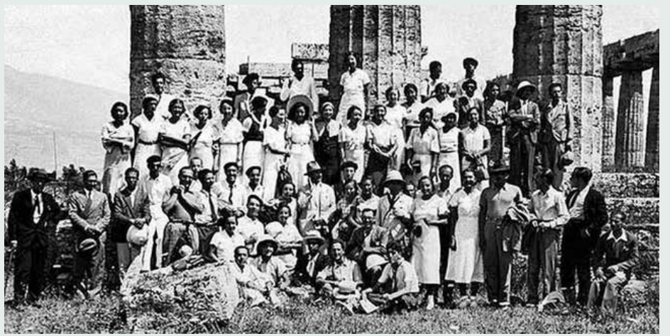
Creuer universitari pel Mediterrani.