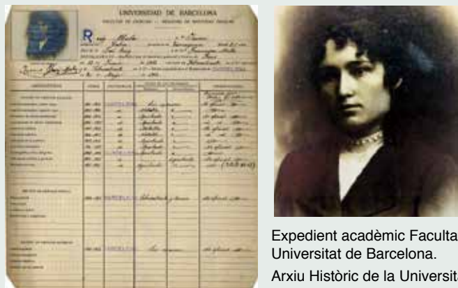
Expedient acadèmic Facultat de Ciències. Universitat de Barcelona. Arxiu Històric de la Universitat de Barcelona 7