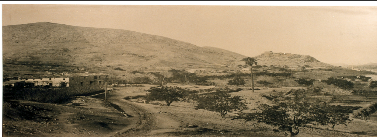
Sierra de la muela [Mola]. Principios s. XX

En este contexto histórico, las citadas leyes se ejecutaron en Alicante en el Juzgado de Primera Instancia el 10 de diciembre de 1867. Se procedió a la preceptiva subasta de los montes del término y jurisdicción de la villa de Novelda llamados: Sierra de los Molinos, Sierra de la Muela [Mola], Sierra Perdiguera, monte Monteagudo y, un monte llamado Algayat. Éste último pertenece en la actualidad al municipio de La Romana, pero en estas fechas pertenecía a Novelda hasta que se independizó de la misma en 1927.